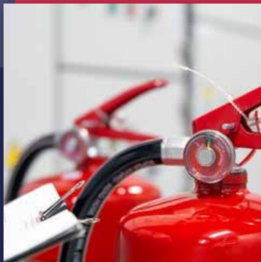
Incendie & Explosion