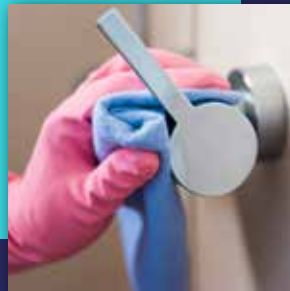
Hygiène, santé prévention