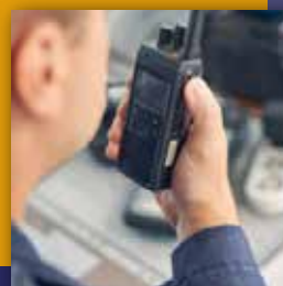
Sécurité, sûreté, malveillance